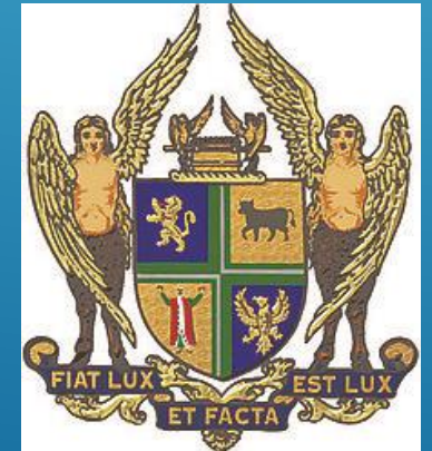
Blason de la GL d'Irlande